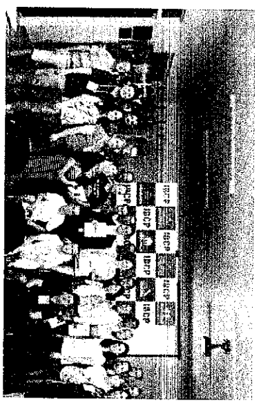
19 DE DEZEMBRO DE 2017

Retrospectiva 2017 - Câmara Municipal de Nova Boa Vista