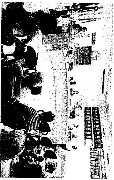
19 DE DEZEMBRO DE 2017

Este é um canal privilegiado de comunicação entre o cidadão e a Câmara.